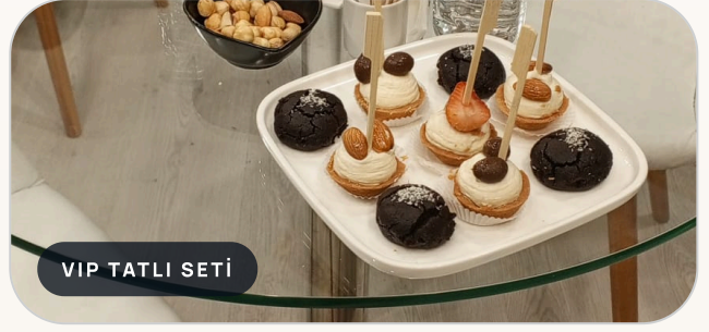
VIP TATLI SETİ

VIP menü; yabancı misafir aırlaması, yönetici görümleri, bayi toplantıları ve daha uzun fuar günleri için önerilir. Kuruyemi ve tatlı setleri daha premium seviyeye çıkarılabilir.